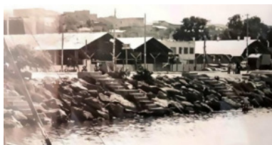
Imagen 3: Empresa INEPACA, Manta 1947