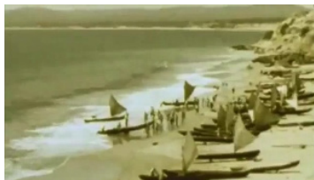
Imagen 2: Playa de Jaramijó, Manta 1949