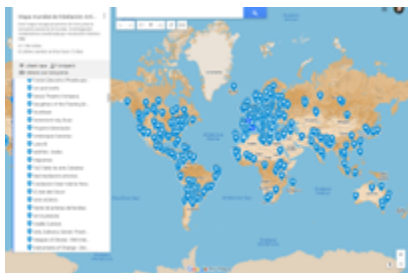
Imagen 1: Vista general del mapa de Mediación Artística (Enlace al mapa: https://www.google.com/maps/d/edit?mid=13ypx9Sx-FtVG-Gy9Q2wGnXR-VOJd6sUzK&ll=-31.035001732073475%2C-64.9455583101971&z=5 )

Tabla número 1: Ítems para incorporar al mapa. Elaboración propia